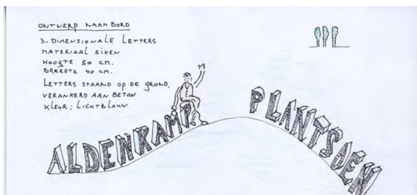
Ontwerp voor parkje Rozenstraat....