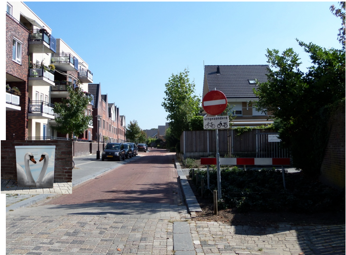
Zwanensteeg nu Begoniastraat