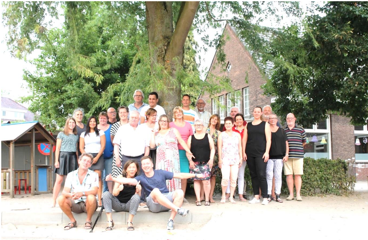
VRIJWILLIGERS ETENTJE EN GROEPSFOTO 2018

Als u voor 15 juni mailt kunt u nog gezellig komen mee-eten!