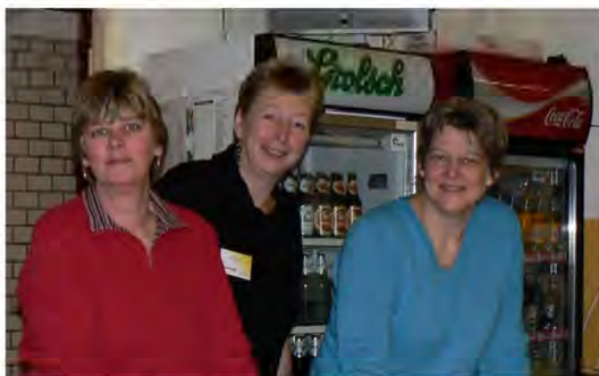
Het bestuur tijdens de nieuwjaarsreceptie van 2010

bewoners optimaal te vertegenwoordigen en hun belangen te behartigen.