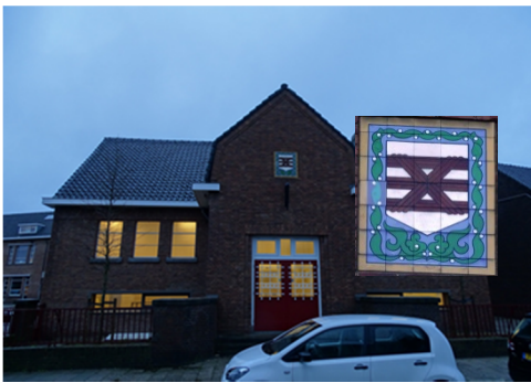
Uitslag vorige fotopuzzel Tulpstraat 65 het Buurthuis

NIEUW OP WINKELCENTRUM 'T RIBBELT U KUNT ONS VINDEN ACHTER DE PRIMERA