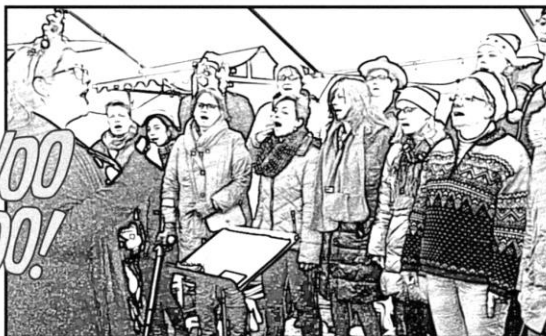
P OPKOOR ENSKÉ BIJ HET KERSTFEEST