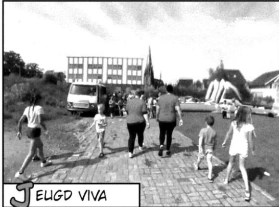
J EUGD VIVA