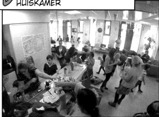
D RUKTE BIJ DE WEKELIJKSE HUISKAMER