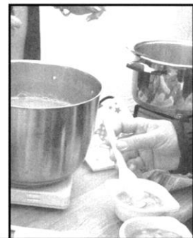
E N OOK SNERT & CHOCO VAN HET RIBW & LEGER DES HEILS