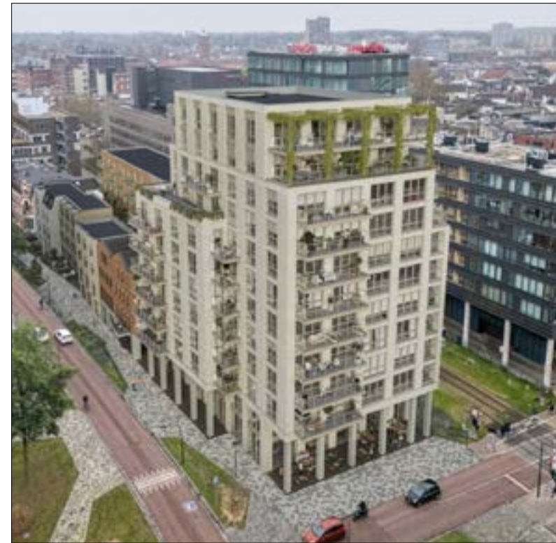
Appartementencomplex Bølke Next, met commerciële functies op de begane grond.

Mocht jij anderen kennen die dit wellicht ook een mooi en zinvol vrijwilligersproject vinden? Tip ze dan!