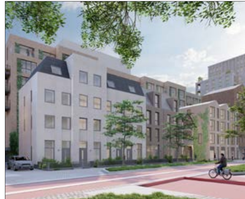
Geschakelde stadsvilla's met inpassing van monumentaal pand. Geheel rechts: Bølke Next.