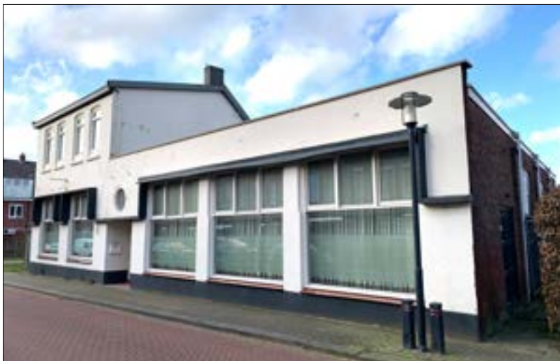
Laaresstraat 27, Het Huis van de Emigrant maakt plaats voor 30 seniorenwoningen.

In de jaren zeventig nam de Spaanse sociëteit er haar intrek en werd het gebouw aan de Laaresstraat ook wel bekend als Het Huis van de Emigrant . De vereniging organiseerde er sinds 1975 vele culturele en maatschappelijke activiteiten. In 2022, na de laatste bingo, werd er een punt achter gezet en ging de deur op slot.