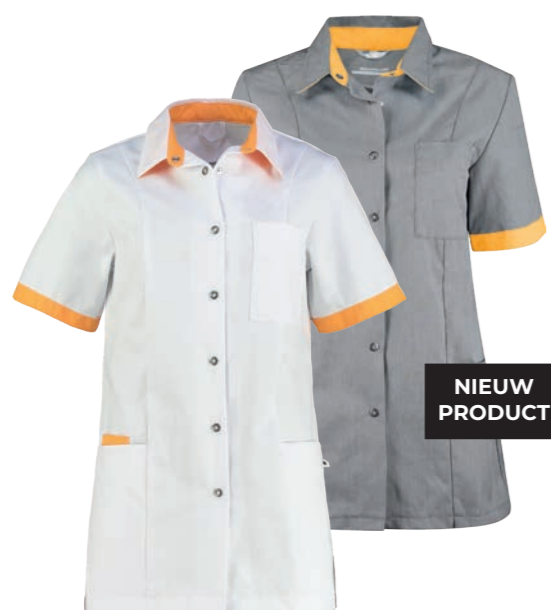
74600* Kleur: wit / sun 9000. Specificatie: 215 g/m2, 65% polyester/ 35% katoen.