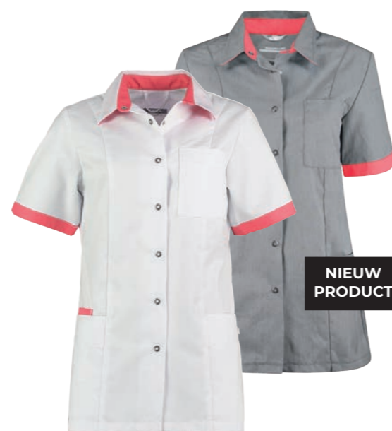
74600* Kleur: wit / orient pink 9121. Specificatie: 215 g/m2, 65% polyester/ 35% katoen.