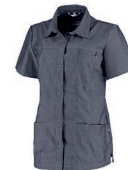
74033* Kleur: magic azur 0410. Specificatie: 215 g/m2, 65% polyester / 35% katoen.