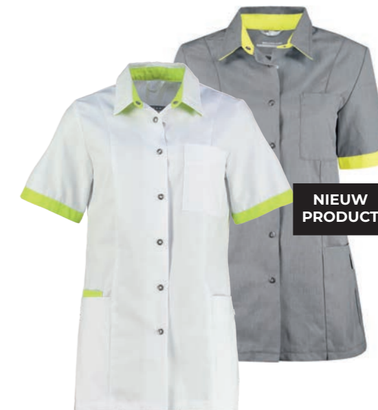
74600* Kleur: wit / sulfur yellow 9610. Specificatie: 215 g/m2, 65% polyester/ 35% katoen.