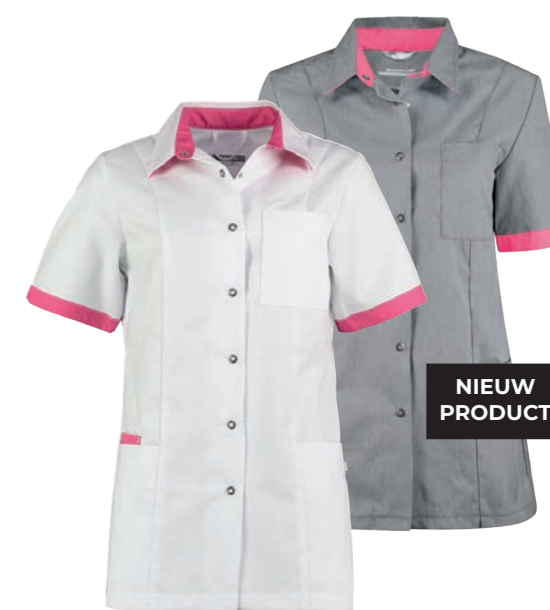
74600* Kleur: wit / shocking pink 9124. Specificatie: 215 g/m2, 65% polyester/ 35% katoen.