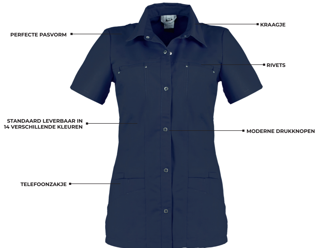
HAEN HIGH LINE DAMESJASJE KARA* 74033

KLEUREN: navy 0600. SPECIFICATIES: 65% polyester / 35% katoen, 195 gm/2. DETAILS: getailleerd, drukknopsluiting, opvallende kraag, jeanslook, moderne borstzakjes met rivets, 2 opgestikte zakken, telefoonzakje, 2 zijsplitjes. MAAT: XS-3XL, lengte: ca. 70 cm.