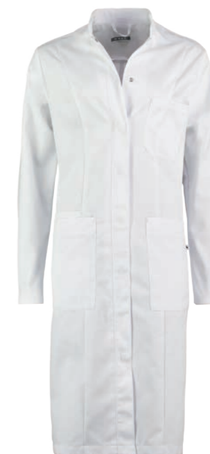
TREND LINE DAMES DOKTERSJAS DAPHNE 74604

KLEUREN: wit 6100. SPECIFICATIES: 245 g/m 2 , 65% polyester/ 35% katoen. DETAILS: rechthoekig, verdekte drukknopsluiting, lange mouw met verstelbaar manchet d.m.v. drukknop, opstaande boord, borstzakje, 1 stethoscoopzakje, 2 opgestikte zakken, rugceintuur. MAAT: 44-62, lengte: ca. 103 cm.