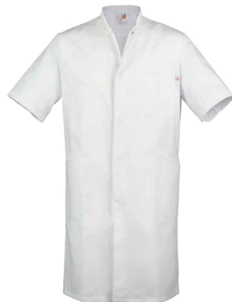
TREND LINE HEREN VERPLEGERSJAS MARCEL 72011

KLEUREN: wit 6100. SPECIFICATIES: 245 g/m 2 , 65% polyester/ 35% katoen. DETAILS: rechthoekig, verdekte drukknopsluiting, korte mouw, opstaande boord, borstzakje, 1 stethoscoopzakje, 2 opgestikte zakken, rugceintuur. MAAT: 44-62, lengte: ca. 103 cm.