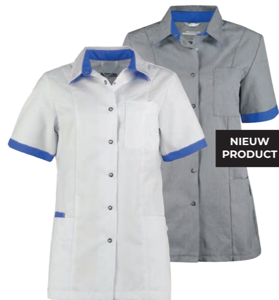
74600* Kleur: wit / royal blue 9123. Specificatie: 215 g/m2, 65% polyester/ 35% katoen.