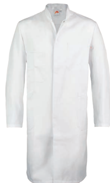
TREND LINE HEREN VERPLEGERSJAS RAMON 72010

KLEUREN: wit 6100. SPECIFICATIES: 245 g/m 2 , 65% polyester/ 35% katoen. DETAILS: rechthoekig, verdekte drukknopsluiting, korte mouw, opstaande boord, borstzakje, 1 stethoscoopzakje, 2 opgestikte zakken, rugceintuur. MAAT: 44-62, lengte: ca. 103 cm.