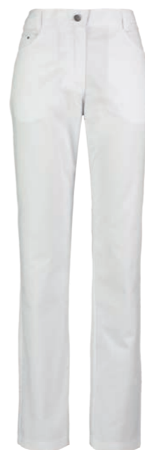
TREND LINE DAMESBROEK TATUM* 74038

KLEUREN: wit 6100. SPECIFICATIES: 215 g/m 2 , 65% polyester/ 35% katoen. DETAILS: normale tailleband, 7 riemlussen, gulp ritssluiting, deel tricot achterzijde, 2 steekzakken, 2 achterzakken, rivets. MAAT: 34-52, binnenbeenlengte: ca. 82 cm.