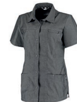
74033 Kleur: grey cross 3330. Specificatie: 185 g/m2, 60% katoen / 40% polyester, plain chambray.