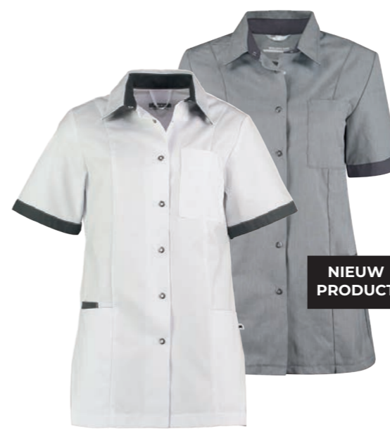
74600* Kleur: wit / charcoal 9122. Specificatie: 215 g/m2, 65% polyester/ 35% katoen.