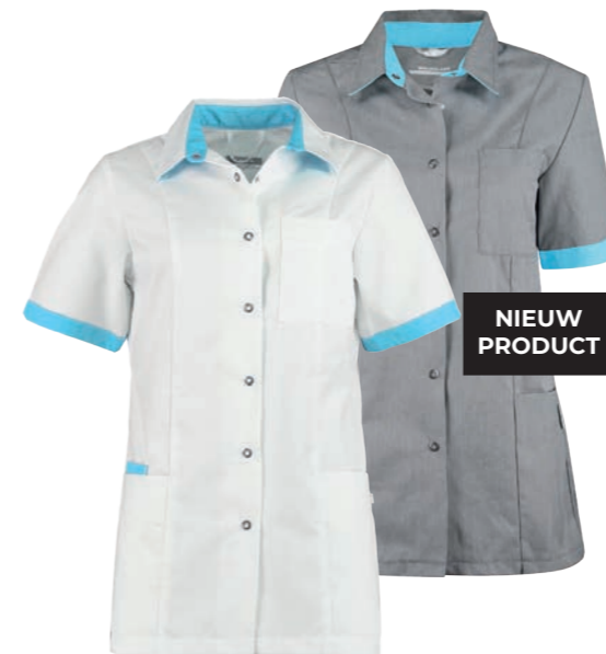
74600* Kleur: wit / magic azur 9125. Specificatie: 215 g/m2, 65% polyester/ 35% katoen.