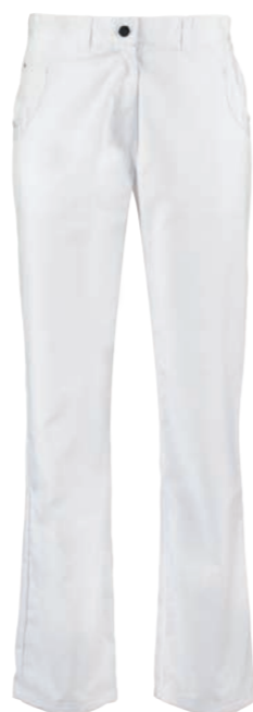
TREND LINE DAMESBROEK KAYLA* 74037

KLEUREN: wit 6100. SPECIFICATIES: 245 g/m 2 , 65% polyester/ 35% katoen. DETAILS: getailleerd, verdekte drukknopsluiting, opstaande boord, lange mouw, borstzakje, 2 opgestikte zakken, loopsplit midden achter. MAAT: XS-3XL, lengte: ca. 105 cm.